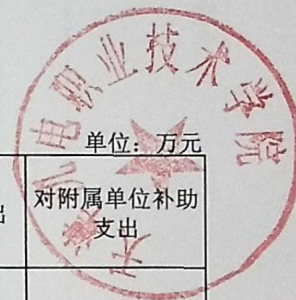
部门支出总体情况表